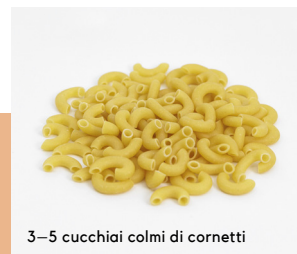
3–5 cucchiaini colmi di cornetti