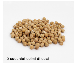
3 cucchiai colmi di ceci