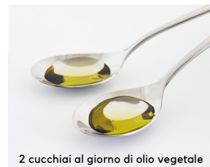
2 cucchiaini al giorno di olio vegetale