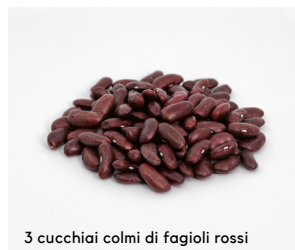
3 cucchiai colmi di fagioli rossi