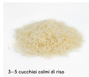
3–5 cucchiaini colmi di riso