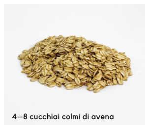
4–8 cucchiaini colmi di avena