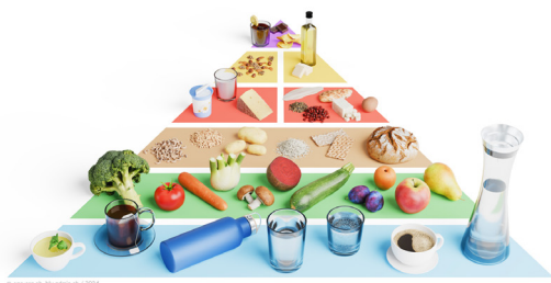
Food Pyramid 2024_Standard